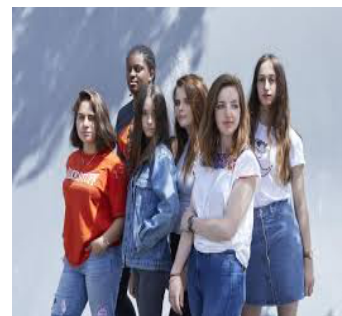
Les jolies filles (as meninas bonitas)