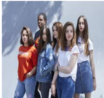
Les jolies filles (as meninas bonitas)