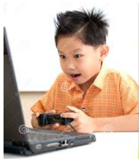
jouer sur l'ordinateur (jogar no computador)